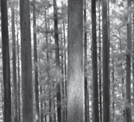
真っ直ぐに育ったスギ林