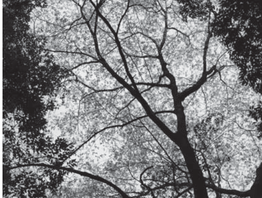
枝を大きく広げるサクラの木

第二の特徴は、加工がしやすいことです。スギやヒノキは比較的軟らかい性質を持つので、削ったり穴を開けたりが容易にできます。そして、第三の特徴は、日本の自然環境に適しているということ。スギは本州以南から屋久島まで、ヒノキは本州（岩手県以南）、四国、九州に分布し、共に日本固有種です。つまり、日本のほとんどの地域で育てられるということです。